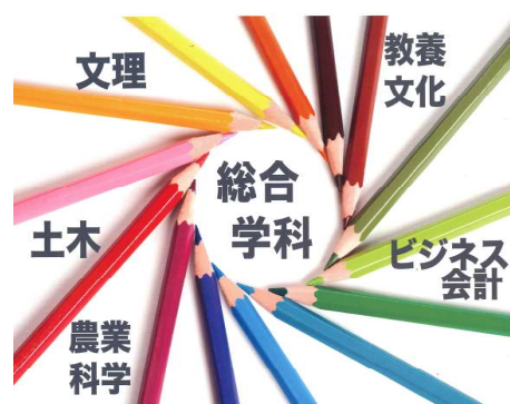
「入学生用学校案内パンフレット」表紙から

また本校には、全国や県大会上位レベルで活躍する部活動を通して心身を鍛え、何事にも積極的に挑戦しようとする生徒が多く学んでいる。今後も、そうした生徒一人ひとりを大切に育みながら、各系列がその特徴を十分に発揮し、進路意識を高める教育活動を一層充実させたい。