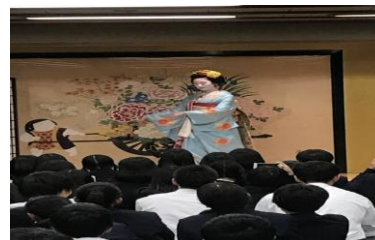
旅館での舞妓さん観賞会

11月14日（火）から17日（金）まで2年生は京都・大阪へ修学旅行に行ってきました。金閣寺や清水寺、ユニバーサルスタジオジャパン、海遊館等の見学・研修を通し、知見を広げ今後の学習活動につながる経験をし、全員健康で秋田に帰ってくる事が出来ました。