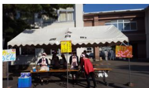
3年生による模擬店

1、2年生は、クラスでとして、クラス毎に来場者に楽しんでもらえる企画を行いました。3年生は生徒玄関前で模擬店を行いました。