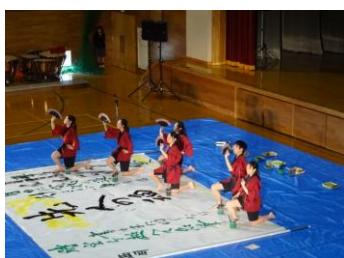
書道パフォーマンス