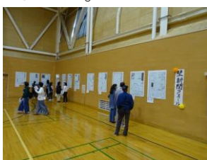
壁新聞コンテスト

この他にも、クラスCMコンテストや書道部による書道パフォーマンス、ビジネス会計系列による販売実習などを行いました。