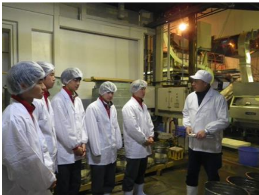
飛良泉本舗さんでの仕込み作業体験の様子

今年度も、農業科学系列の生徒が栽培した「秋田酒こまち」を使用した純米大吟醸「醒 SA」が由利本荘市と、にかほ市内で販売されています。日本酒の製造は、にかほ市にある株式会社飛良泉本舗さんに依頼しました。仕込みや樽入れなどの作業は、本校農業系列の生徒も体験しています。限定 2,000本の販売です。