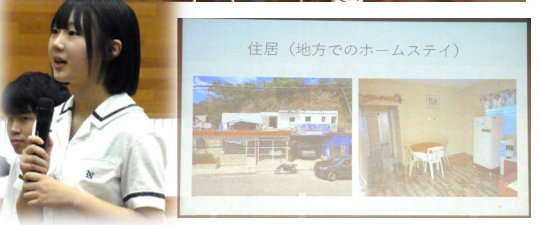
住居(地方でのホームステイ)