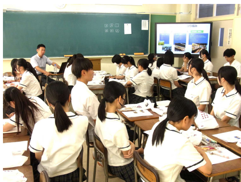
株式会社秋田ニューバイオフィーム