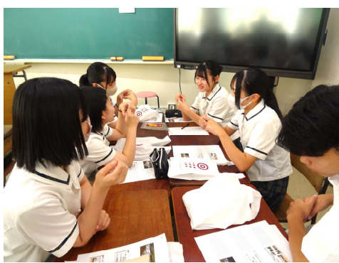
食品の新商品開発検討、発表の様子