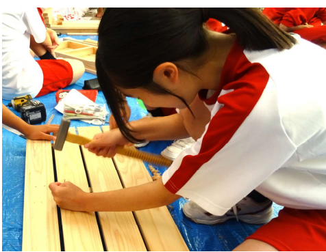
ベンチ制作の様子