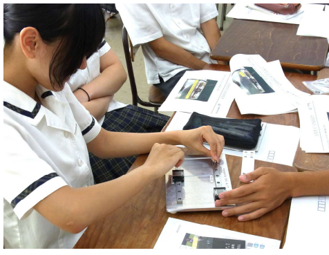
ガイドレール取り付けの様子