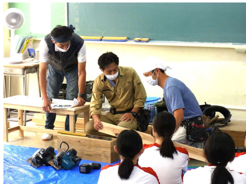
有限会社ミノル建設