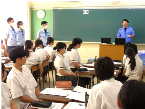
丸大機工株式会社

り付け」、「有限会社ミノル建設」は「ベンチの制作」、「株式会社秋田ニューバイオフィーム」は「食品の商品開発会議」の体験をそれぞれ行いました。参加した1年生のみなさんはしっかりとした態度で話を聴き、体験作業にも積極的に取り組んでいました。